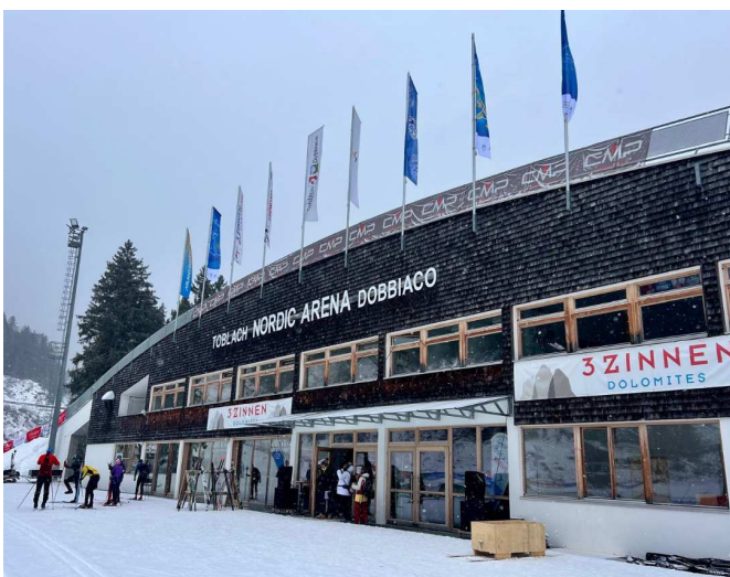
Loipenstadion von Toblach mit Schneefall