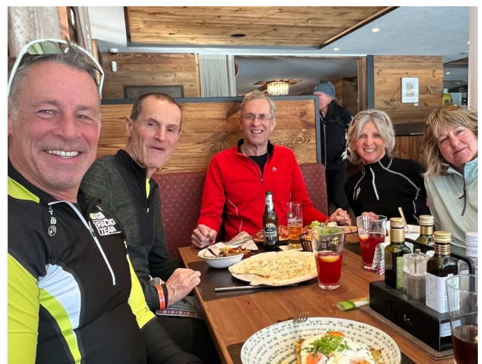
Kohlehydratspeicher füllen ☺